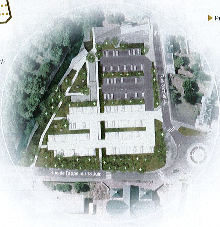
► Projet d'aménagement