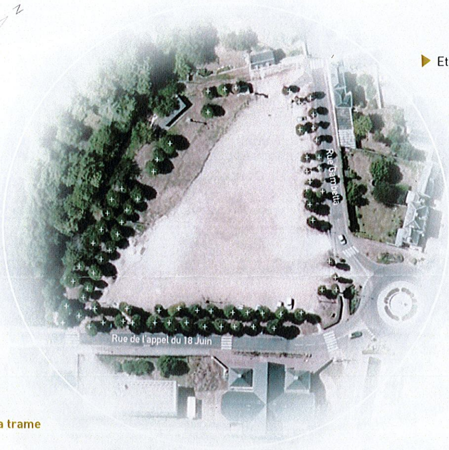
► Etat actuel de la place